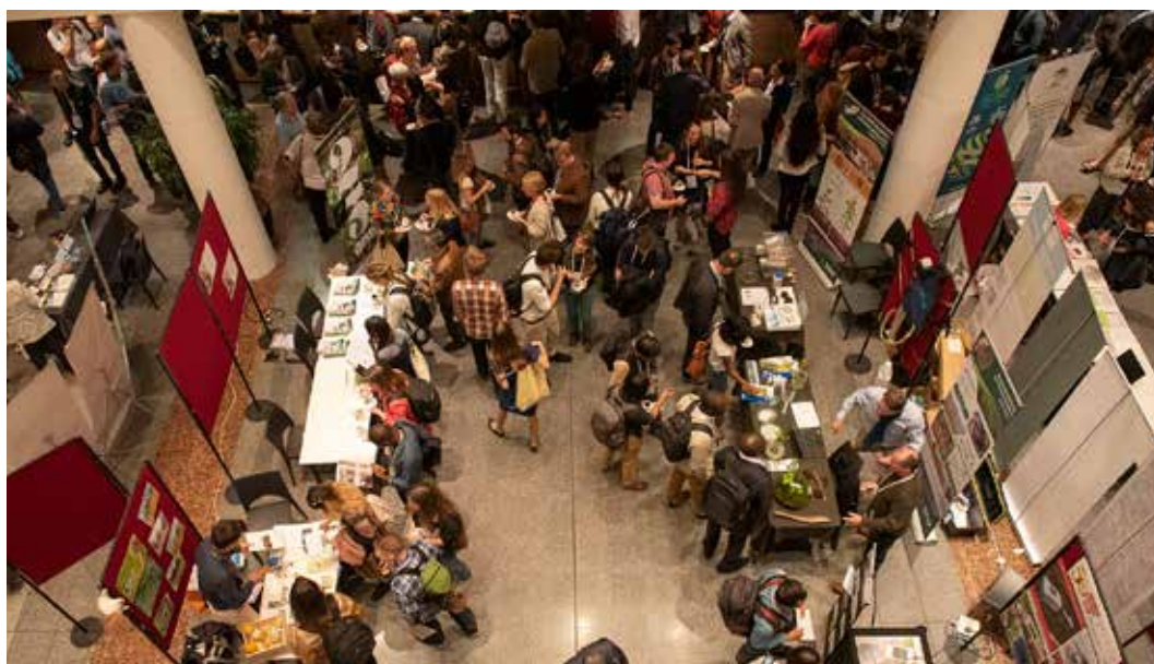
Le 4 e Congrès mondial d'Agroforesterie organisé par le CIRAD et INRAE, en partenariat avec World Agroforestry, Agropolis International et Montpellier Université d'Excellence. 1 200 participants, en provenance de plus de 100 pays.

> Une politique de programmes prioritaires internationaux , visant à accélérer les recherches sur de grands enjeux correspondant aussi à des priorités nationales et européennes (sols et chan-