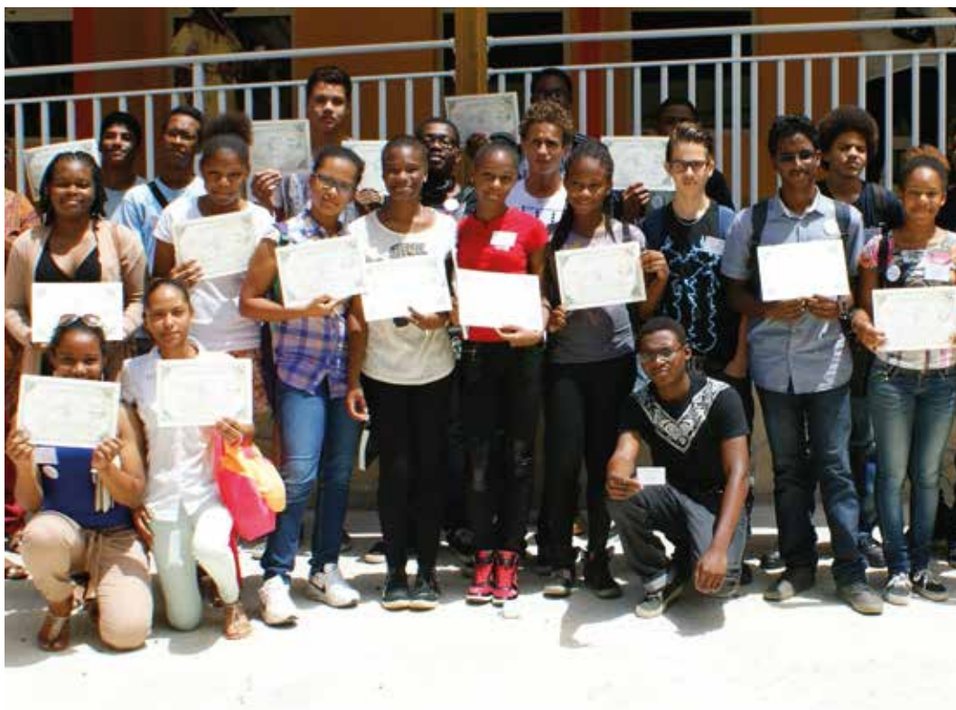
▼ les Apprentis Chercheurs du centre Antilles-Guyane