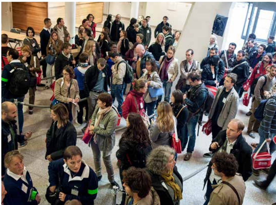
▼ ADN Accueil des nouveaux arrivants