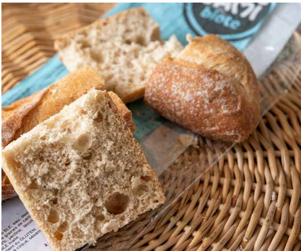
▼ Fruit de plusieurs années de recherches, cette baguette contient des fibres végétales sélectionnées pour leurs effets bénéfiques sur le microbiote. (MICA)