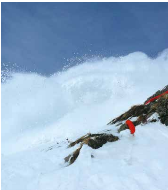
▼ Déclenchement et observation d'avalanche sur le site expérimental du Col du Lautaret Unité : Érosion Torrentielle, Neige et Avalanches (ETNA)