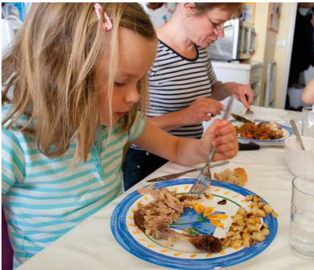
▼ Repas familial